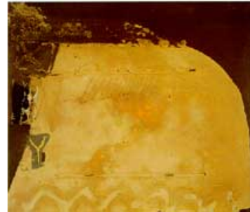
Marrón y Ocre, 1959

Los artistas del grupo Dau al Set (1948-1953), entre ellos Antoni Tàpies y Modest Cuixart, que colaboraron en su fundación, partiendo de la ensoñación y el automatismo surrealista llegaron a la abstracción matérica.