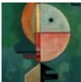
W. Kandinsky, Upwards , 1929.