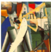
K. Malevich, Aviador , 1914, óleo sobre lienzo, 125 x 65 cm.