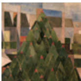
T. van Doesburg, Árbol , 1916, óleo sobre madera, 66 x 55´9 cm.