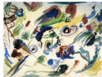
Primera acuarela abstracta. Kandinsky, 1910.

Color, forma, textura toman el relevo a los paisajes, bodegones y retratos. Ya no se copia de la realidad. El arte abstracto es el arte que habla de si mismo, no intenta representar nada. Es el arte por el arte.