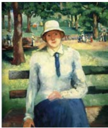
Chica sin trabajo 1903