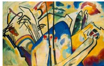
Composición IV Kamdinsky

Expresa un estado emocional. Cada color comunica un sentimiento y, según el mismo explicó, para él cada color equivale a un sonido. Y es que para Kandinsky música y pintura están vinculadas, como escribe en su libro "Sobre lo espiritual en el arte" (1911).