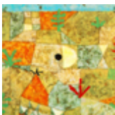
P. Klee, Jardines del sur , 1936, óleo sobre papel montado en cartón.