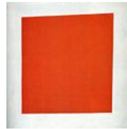
Red Square 1915

Si analizamos por ejemplo Círculo Negro , podemos ver que la composición pictórica está formada únicamente por un gran círculo negro que ocupa la mayoría del lienzo. A pesar de lo simple de la obra, es equilibrada. La contraposición del blanco y el negro, la ausencia del color y todos los colores en uno, dan todavía más contraste al lienzo.